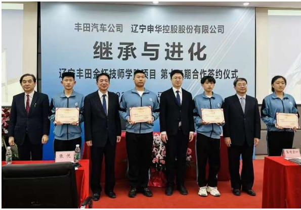
校企双方领导为获得丰田奖学金的学生代表颁奖